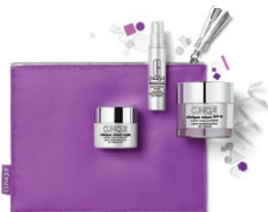
Smart Moisturizer Value Set CHF 80.- (Warenwert CHF 135.-)