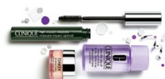
High Impact Mascara Set CHF 35.- (Warenwert CHF 60.-)