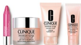
Moisture Surge Deluxe Set CHF 39.- (Warenwert CHF 73.-)